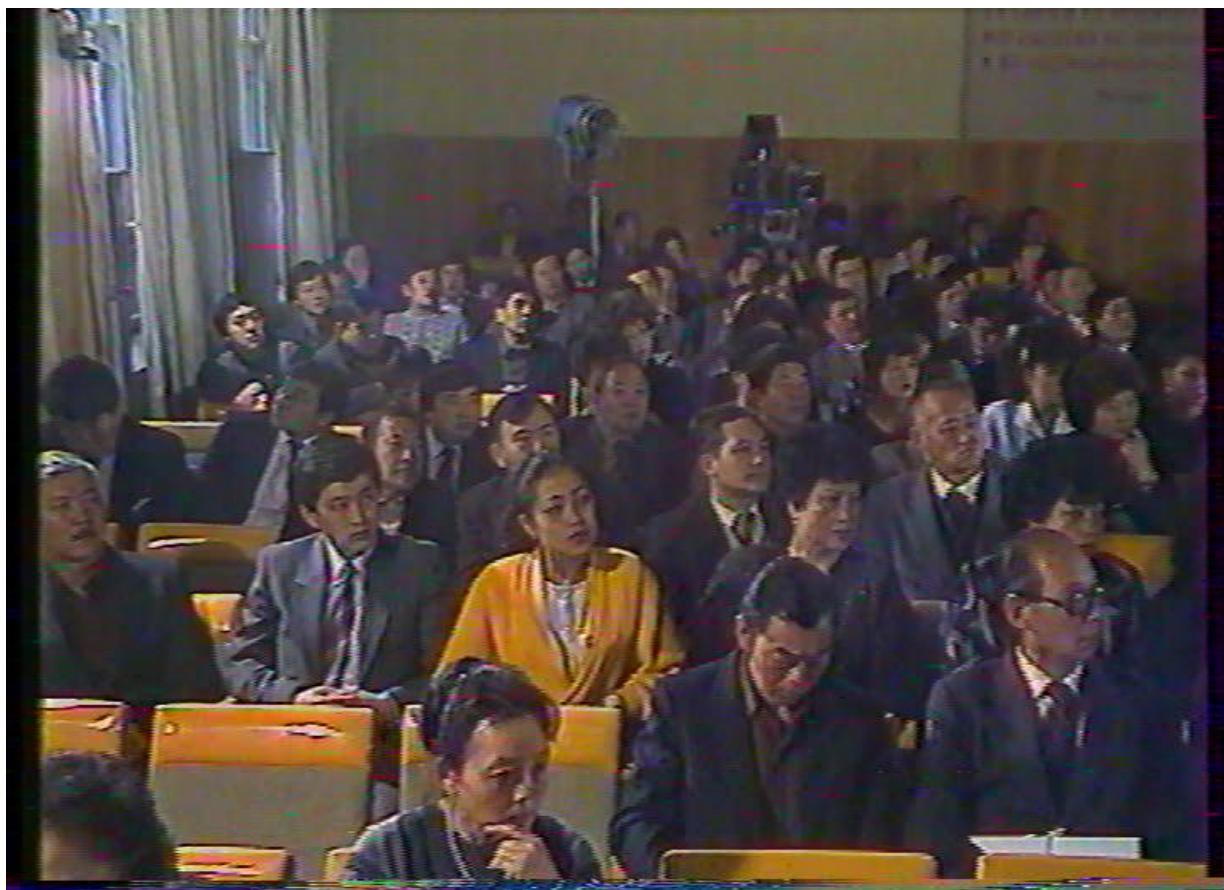
Делегаты I Учредительной конференции ДКЦ в г.Алма-Ате