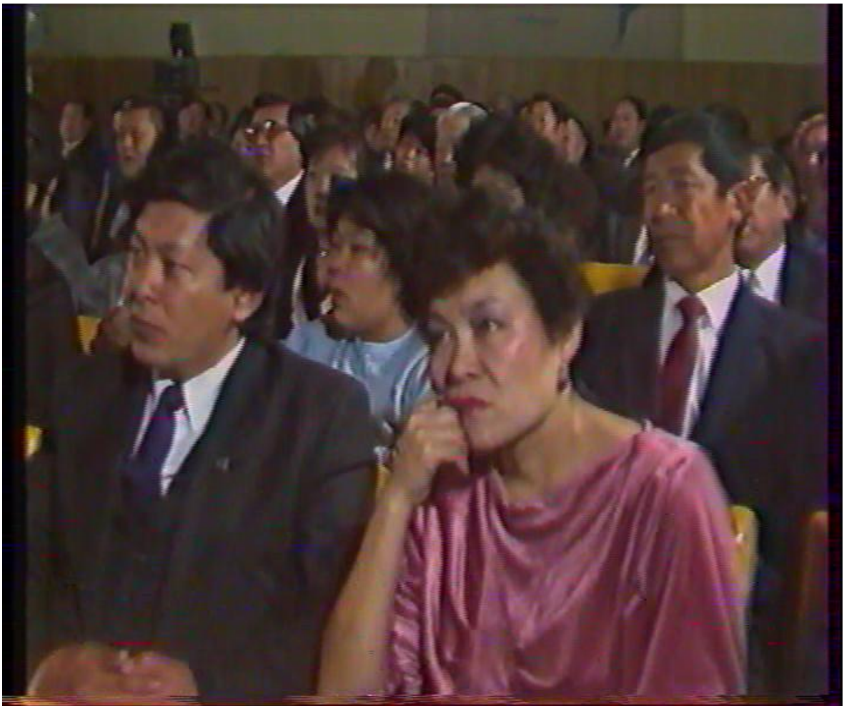
Делегаты I Учредительной конференции ДКЦ в г.Алма-Ате