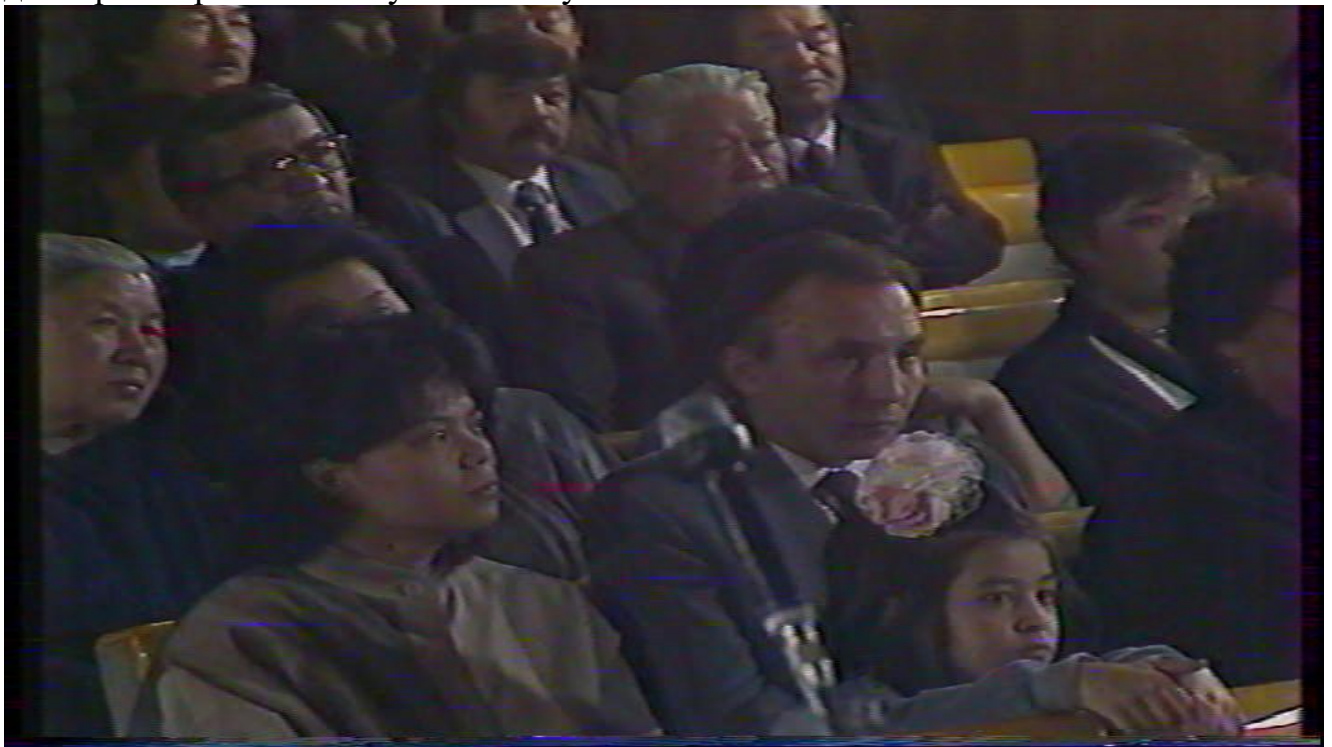
Делегаты I Учредительной конференции ДКЦ в г.Алма-Ате